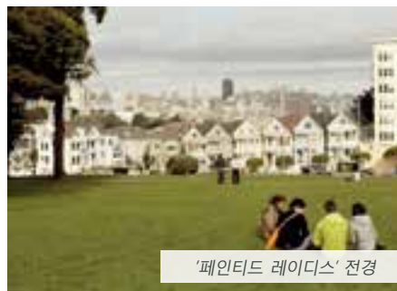
'페인트 레디스' 전경