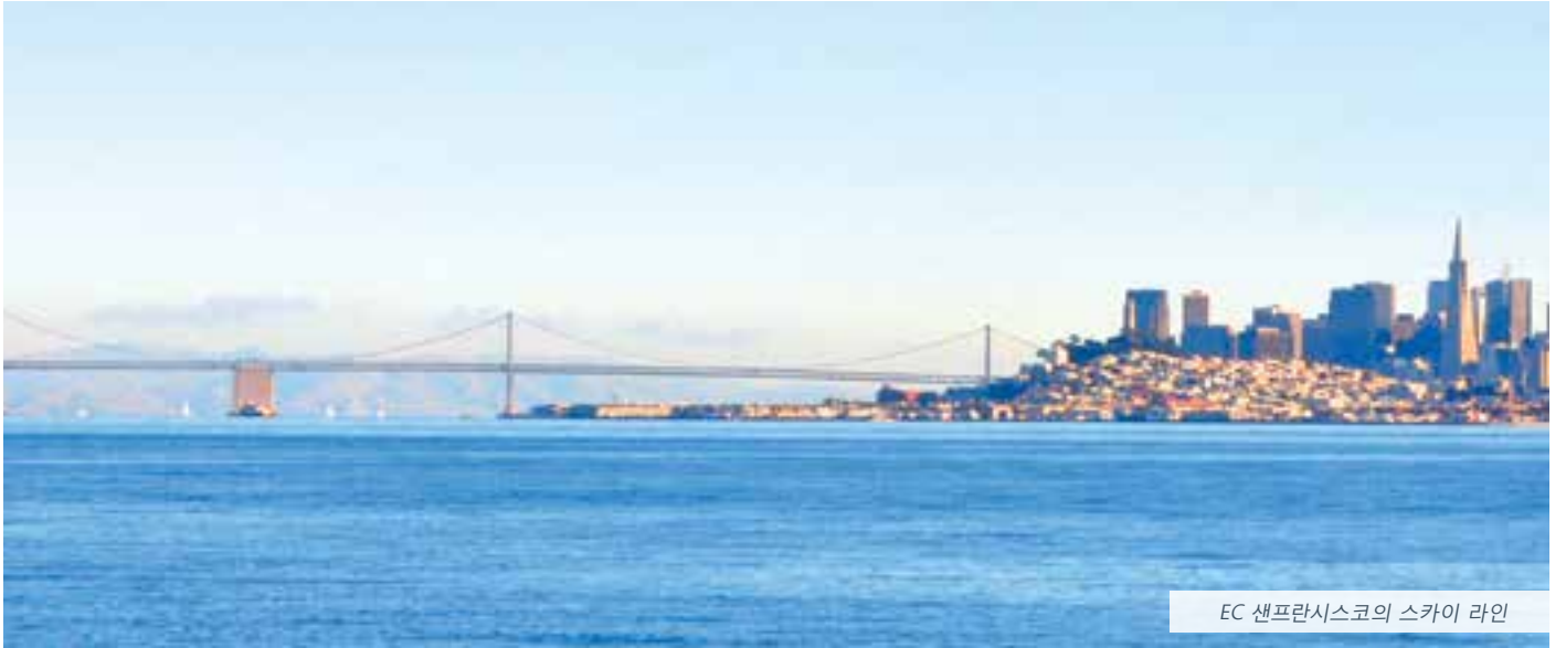
EC 샌프란시스코의 스카이 라인