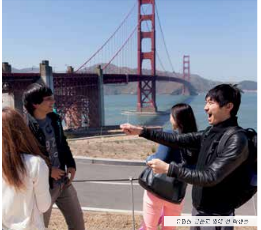
유명한金門교 옆에 선 학생들