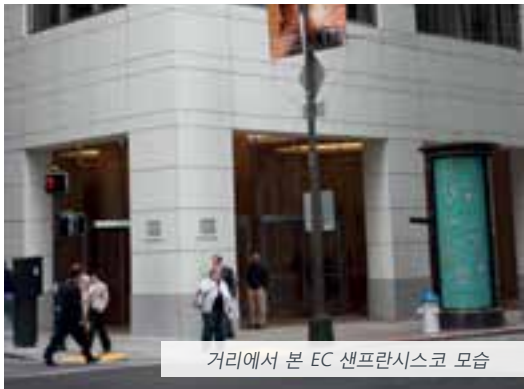
거리에서 본 EC 샌프란시스코 모습