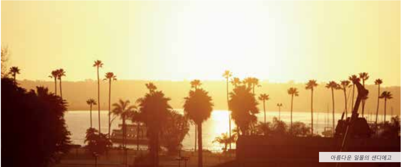
아름다운 일몰의 샌디에고