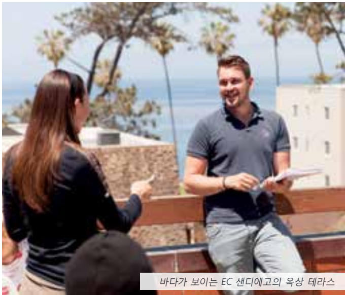
바다가 보이는 EC 샌디에고의 옥상 테라스