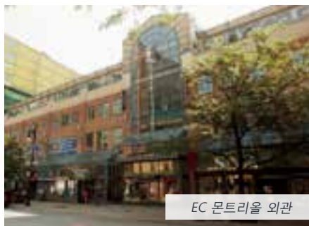
EC 몬트리올 외관

DISTANCE FROM EC NOTRE DAME BASILICA 2.8KM OLD MONTREAL 2.5KM LA RONDE AMUSEMENT PARK 7.4 KM