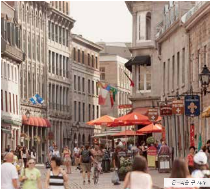
몬트리올 구 시가