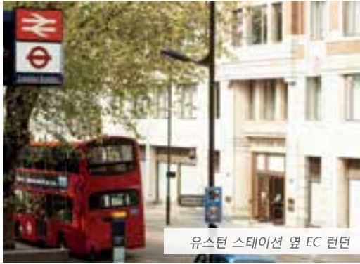
유스턴 스테이션 옆 EC 런던