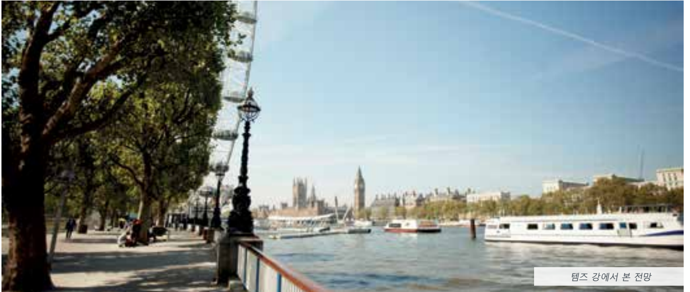
템즈 강에서 본 전망