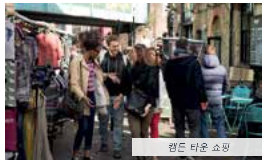
캠든 타운 쇼핑