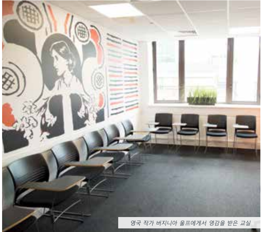
영국 작가 버지니아 울프에게서 영감을 받은 교실