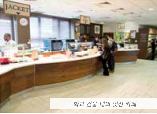
학교 건물 내의 멋진 카페