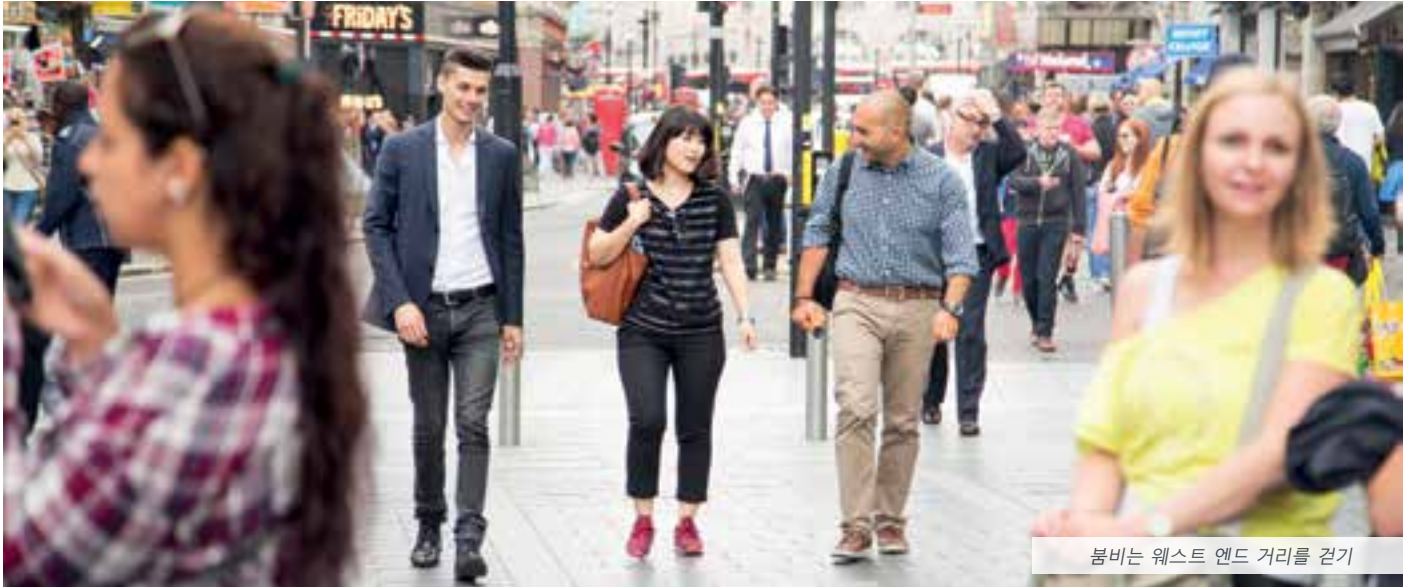
봄비는 웨스트 엔드 거리를 걷기