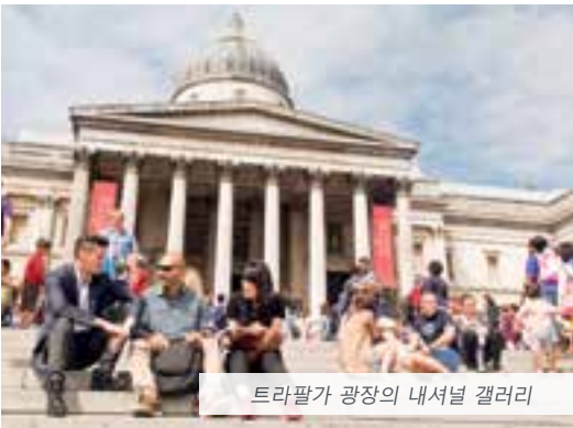
트라팔가 광장의 내셔널 갤러리