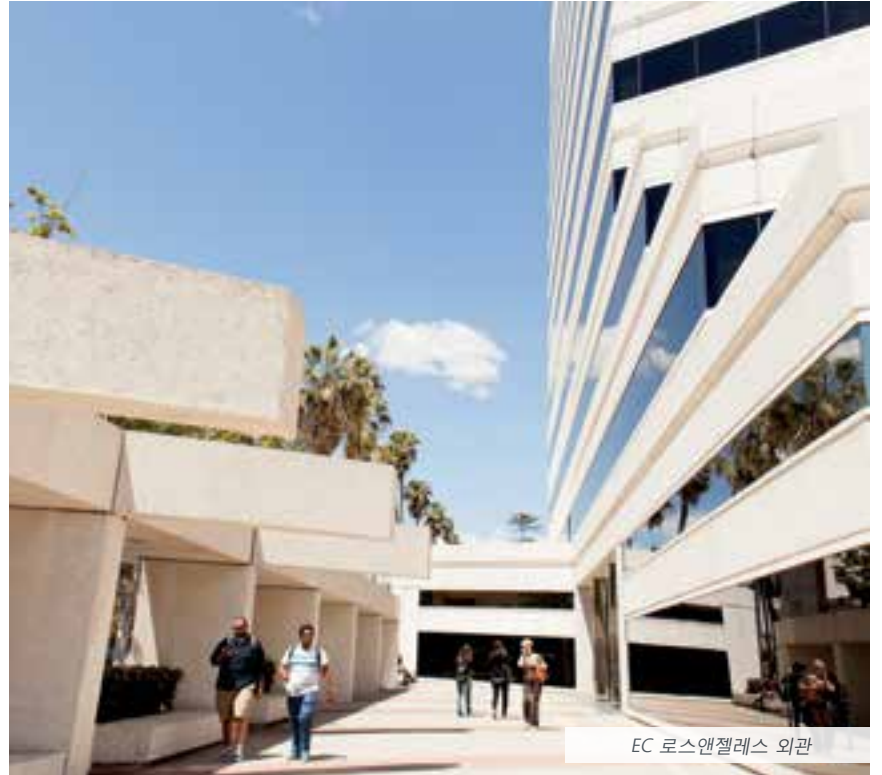
EC 로스앤젤레스 외관