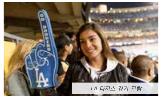
LA 다저스 경기 관람