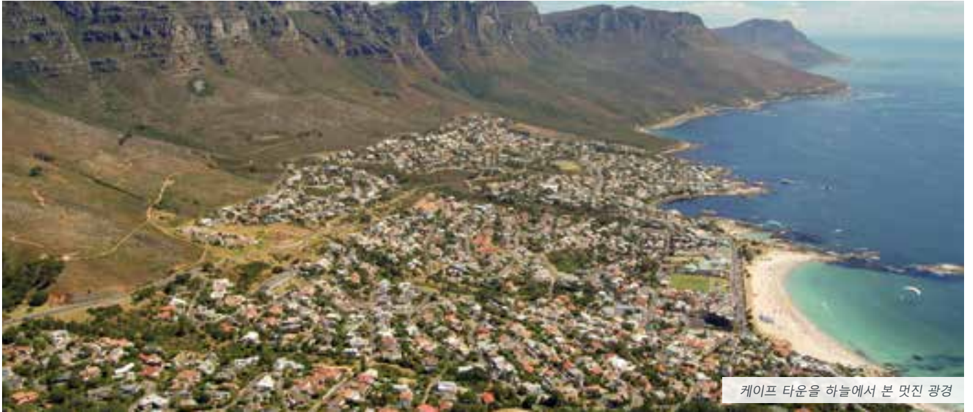
케이프 타운을 하늘에서 본 멋진 광경