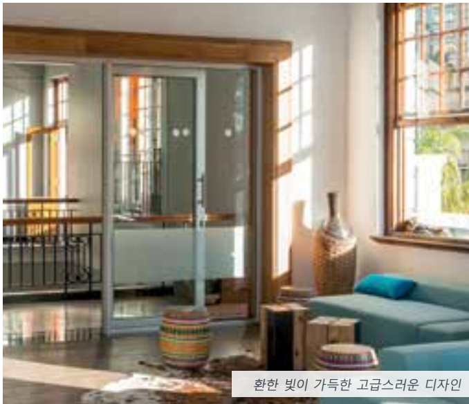
환한 빛이 가득한 고급스러운 디자인