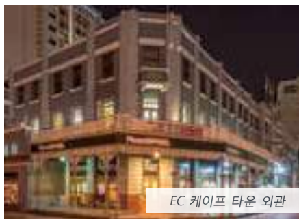
EC 케이프 타운 외관