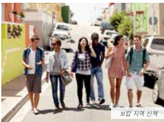
보카프 지역 산책