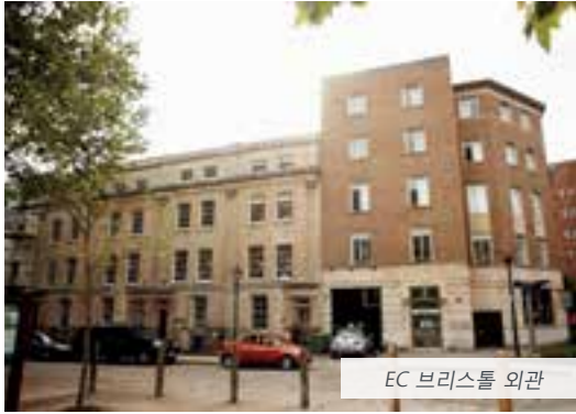
EC 브리스틀 외관