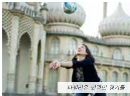
파빌리온 외곽의 경이들