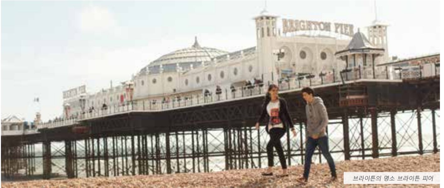
브라이튼의 명소 브라이튼 피어