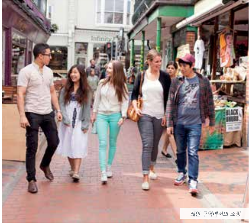
레인 구역에서의 쇼핑