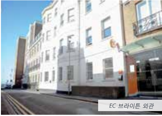
EC 브라이튼 외관