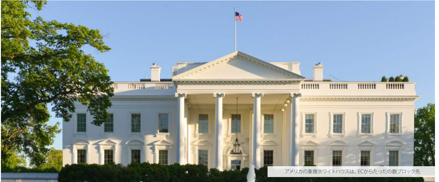
アメリカの象徴ホワイトハウスは、ECからたったの数ブロック先