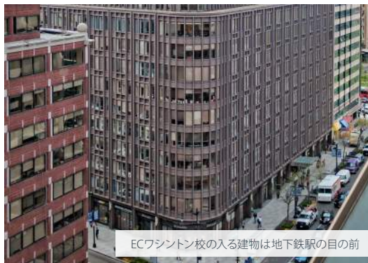
ECワシントン校の入る建物は地下鉄駅の目の前