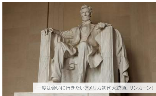
一度は会いに行きたいアメリカ初代大統領、リンカーン!