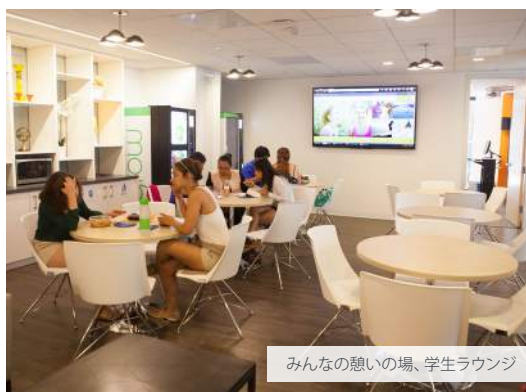
みんなの憩いの場、学生ラウンジ