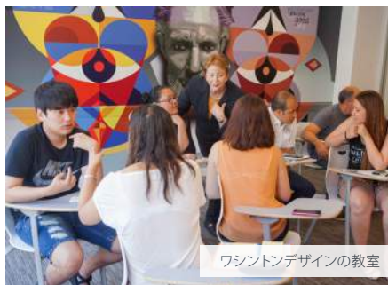
ワシントンデザインの教室