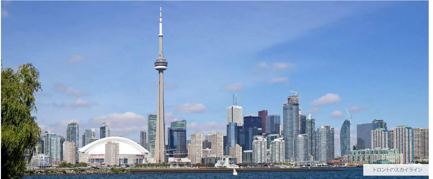
トロントのスカイライン