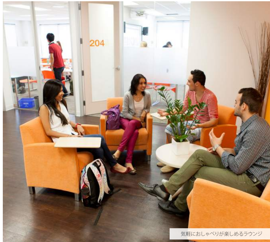
気軽におしゃべりが楽しめるラウンジ