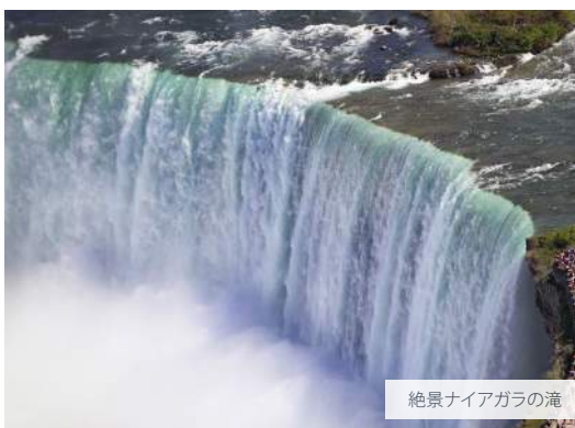
絶景ナイアガラの滝