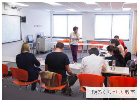
明るく広々した教室