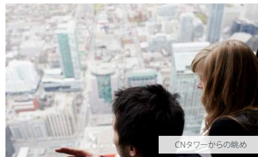
CNタワーからの眺め