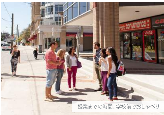
授業までの時間、学校前でおしゃべり