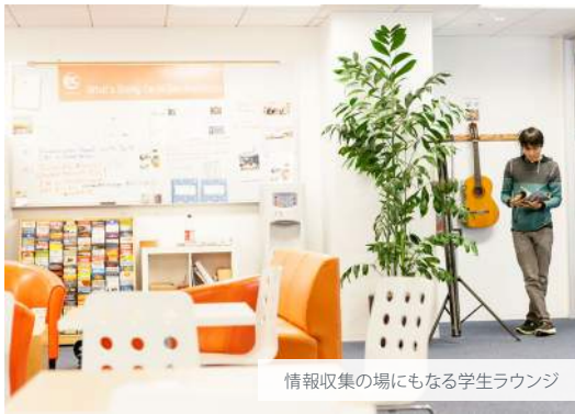
情報収集の場にもなる学生ラウンジ