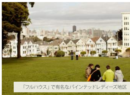
「パリアウス」で有名なペイントドレディーズ地区