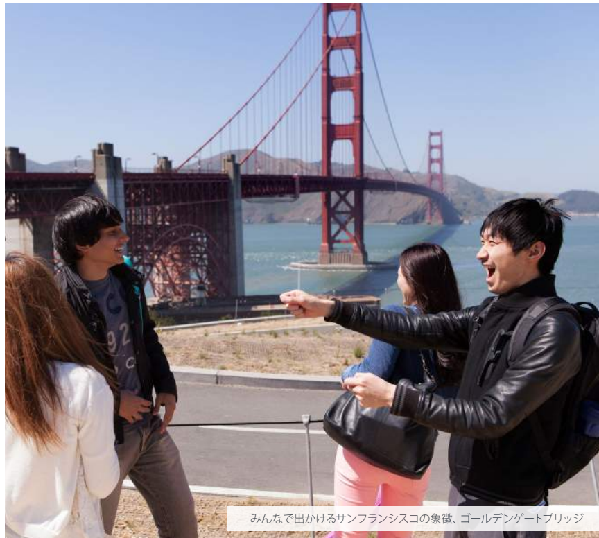
みんなで出かけるサンフランシスコの象徴、ゴールデンゲートブリッジ