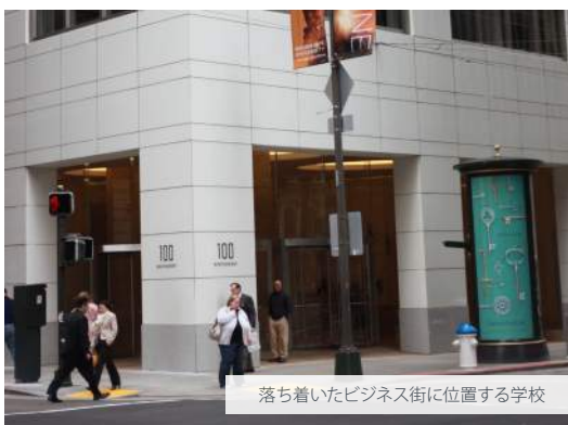
落ち着いたビジネス街に位置する学校