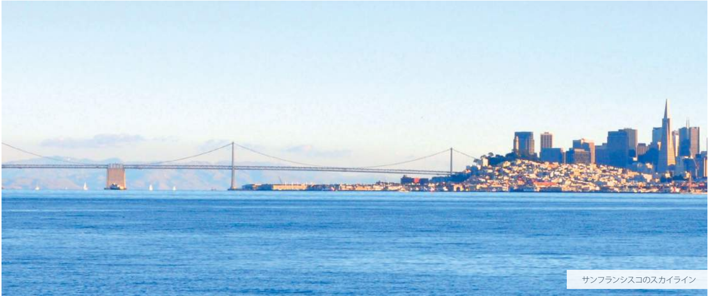
サンフランシスコのスカイライン