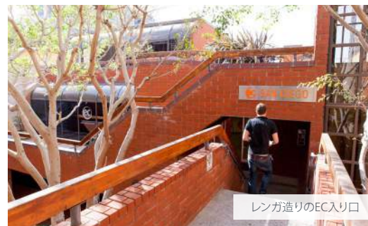
レンガ造りのEC入り口