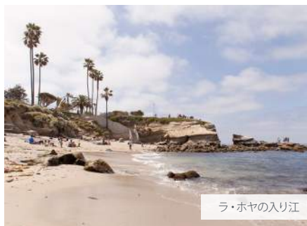
ラ・ホヤの入り江