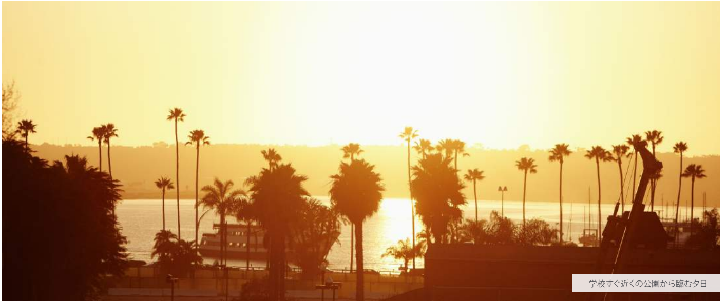
学校すぐ近くの公園から臨む夕日