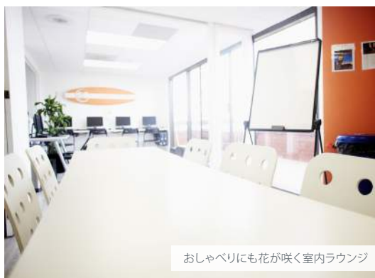
おしゃれにも花が咲く室内ラウンジ