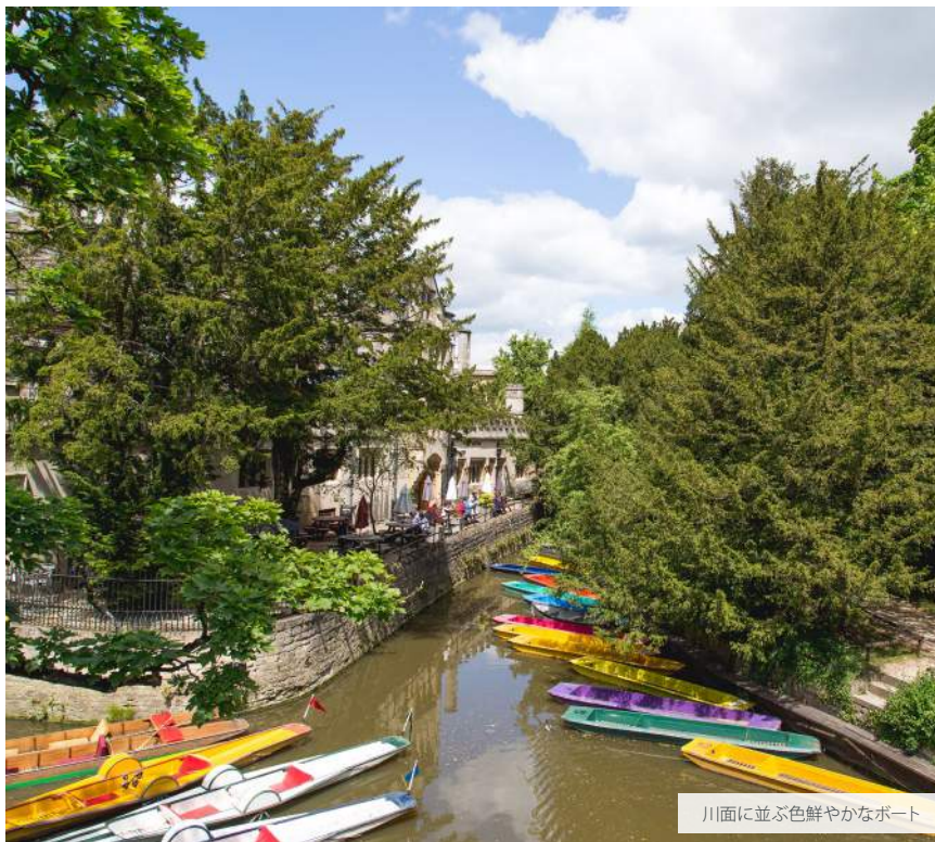
川面に並ぶ色鮮やかなボート