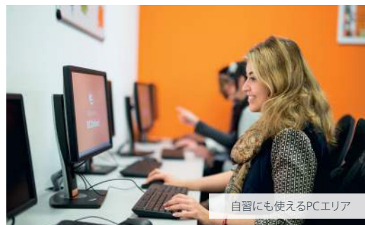
自習にも使えるPCエリア