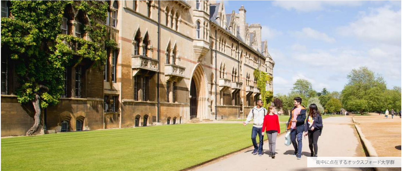
街中に点在するオックスフォード大学群