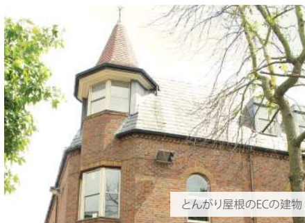
とんがり屋根のECの建物