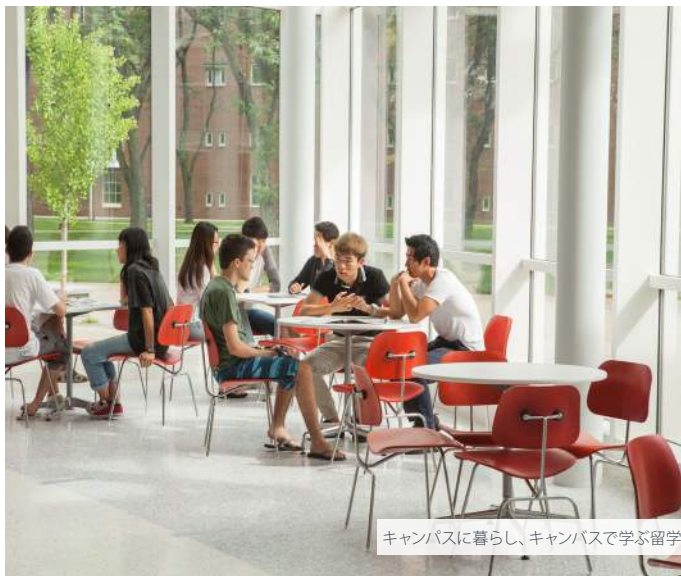
キャンパスに暮らし、キャンパスで学ぶ留学