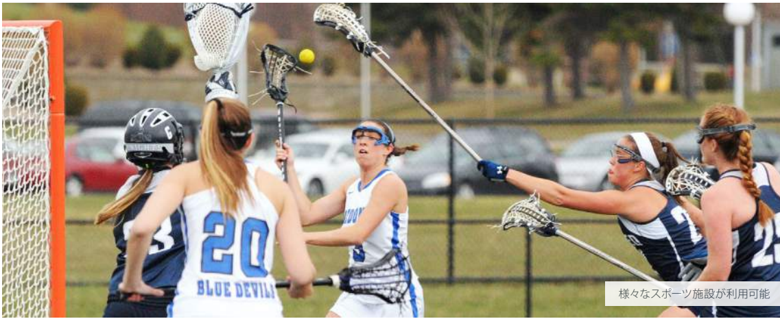
様々なスポーツ施設が利用可能