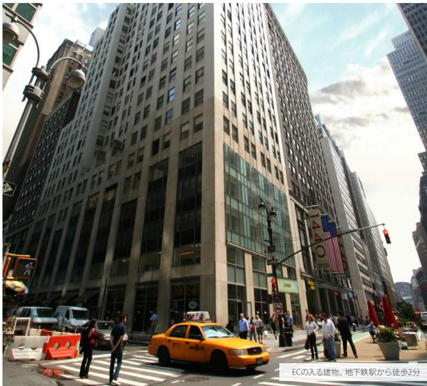
ECの入る建物。地下鉄駅から徒歩2分