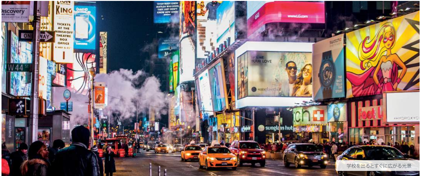
学校を出るとすぐに広がる光景