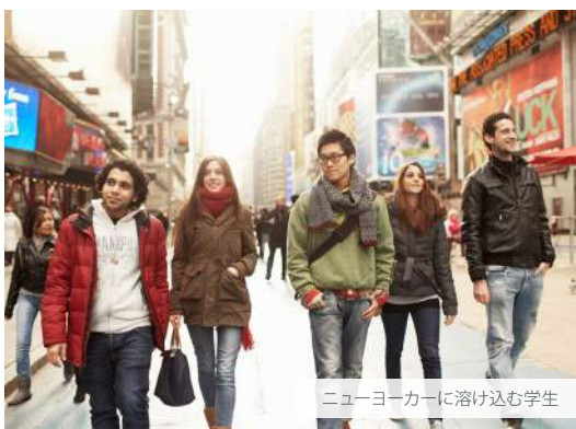
ニューヨークカーに溶け込む学生