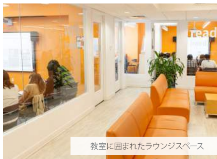
教室に囲まれたラウンジスペース