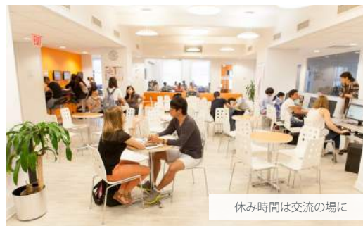
休み時間は交流の場に