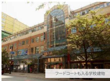
フードコートも入る学校建物