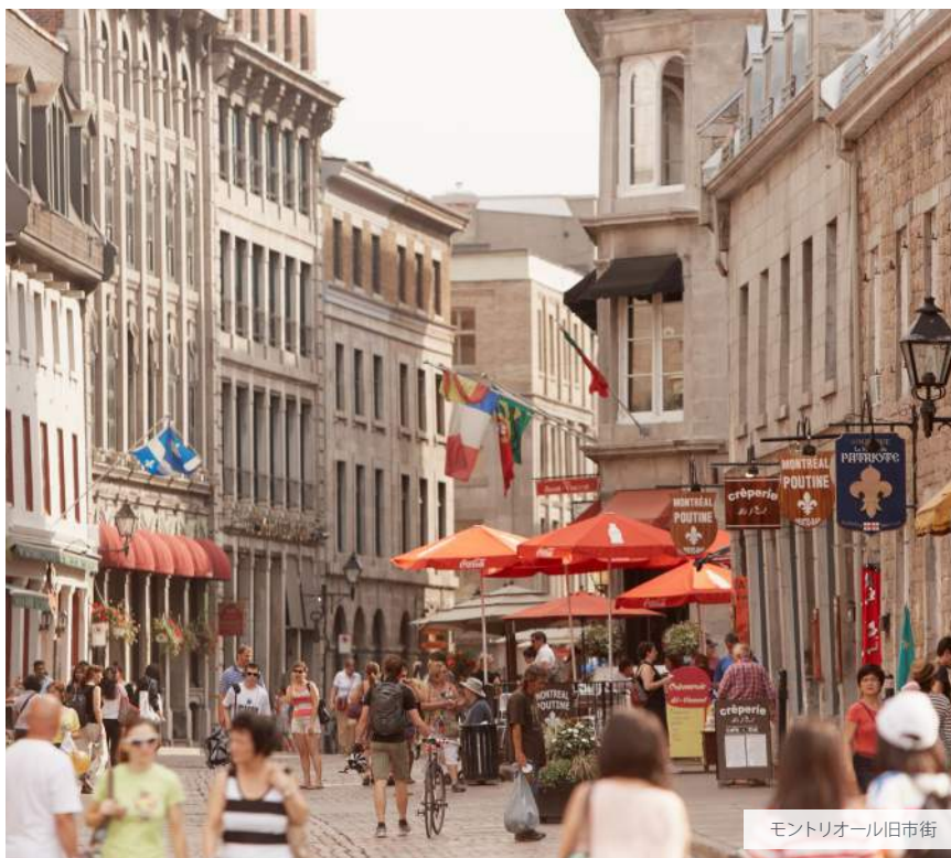
モンリオール旧市街