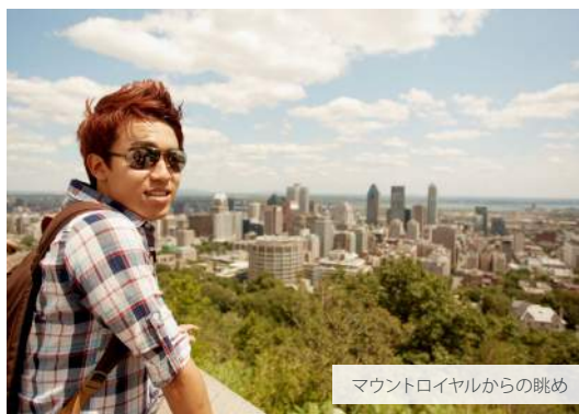
マウントロイヤルからの眺め