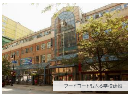
フードコートも入る学校建物