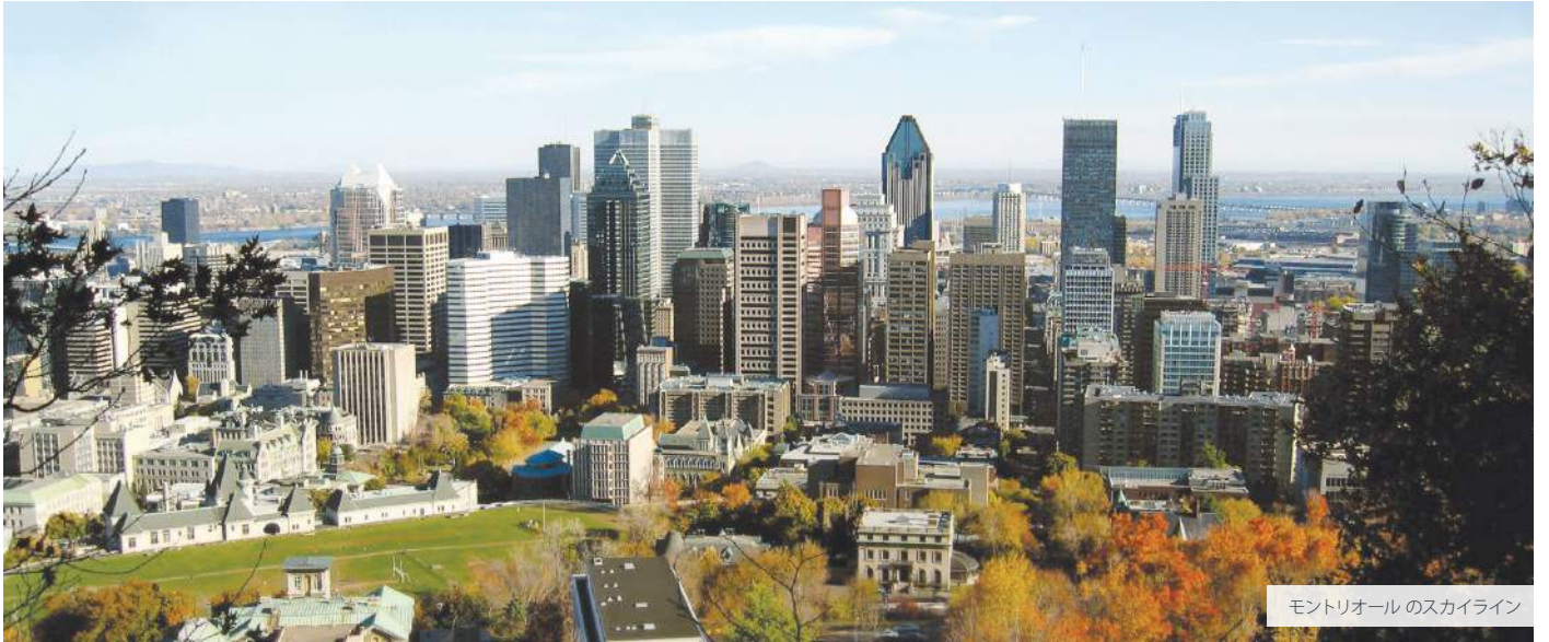
モントリオールのスカイライン