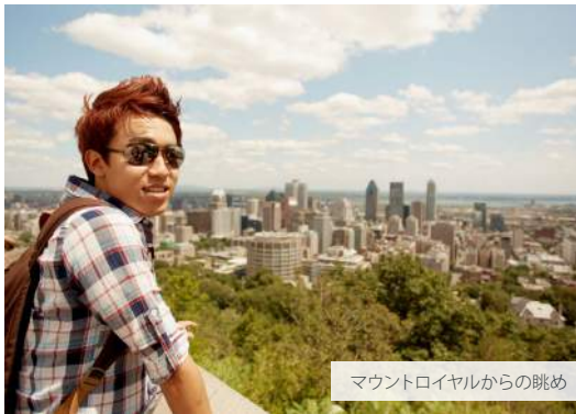
マウントロイヤルからの眺め