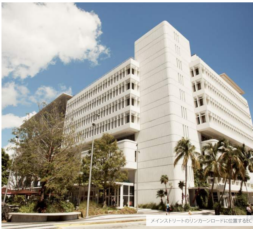
メインストリートのリンカーンロードに位置するEC