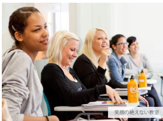
笑顔の絶えない教室