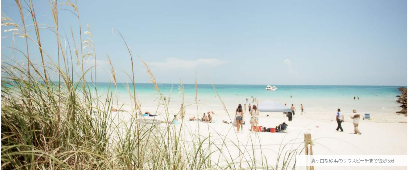
真っ白な砂浜のサウスビーチまで徒歩5分