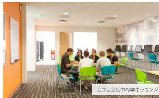
カフェ会話中の学生ラウンジ