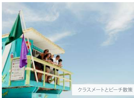
クラスメートとビーチ散歩