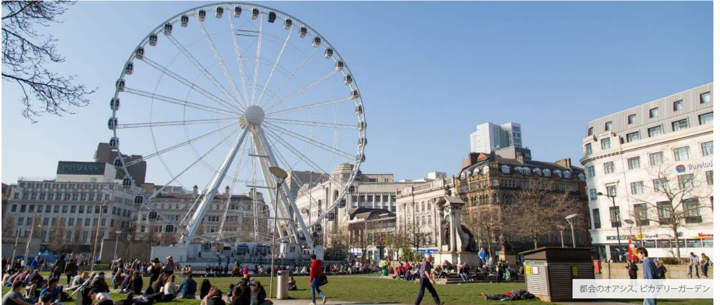
都会のオアシス、ピカデリーガーデン

Accredited by the BRITISH COUNCIL for the teaching of English ENGLISHUK member