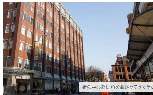
街の中心部は角を曲がってすぐそこ