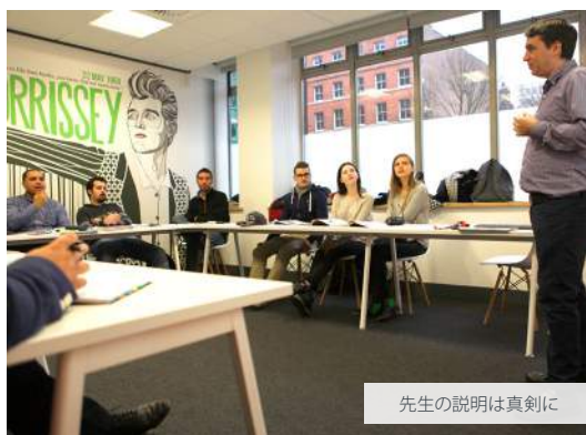
先生の説明は真剣に