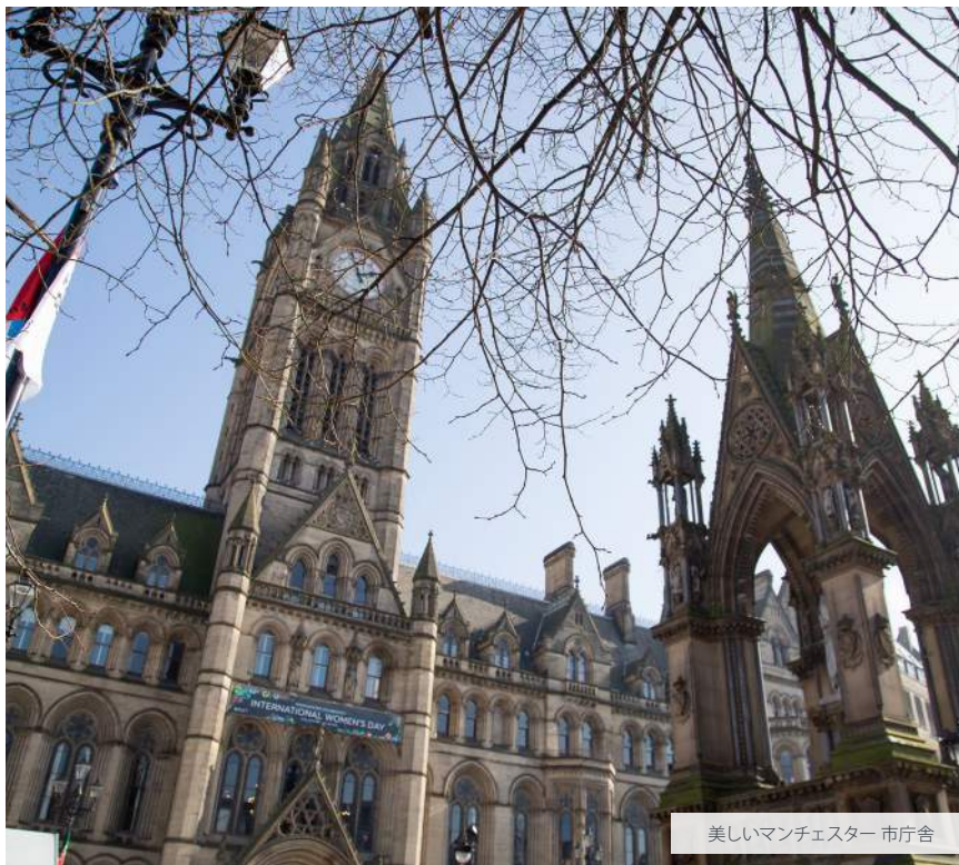
美しいマンチェスター 市庁舎