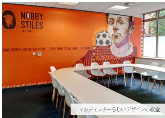
マンチェスターらしいデザインの教室