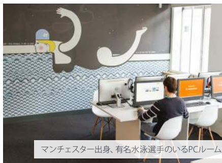
マンチェスター出身、有名水泳選手のいるPCルーム