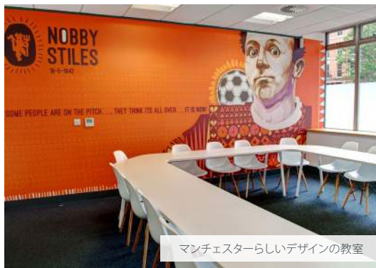
マンチェスターらしいデザインの教室