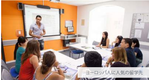
ヨーロッパ人に人気の留学先