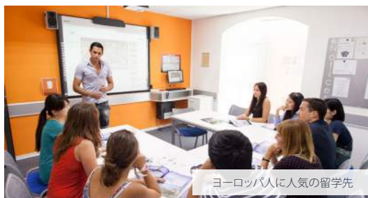
ヨーロッパ人に人気の留学先