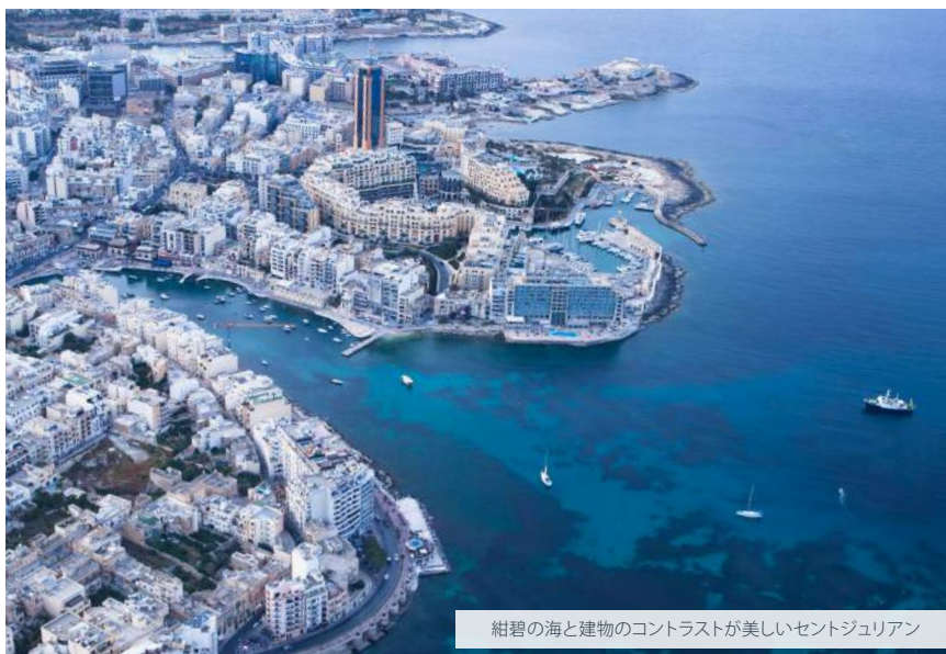
紺碧の海と建物のコントラストが美しいセントジュリアン