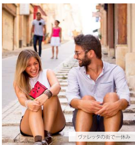
ヴァレッタの街で一休み