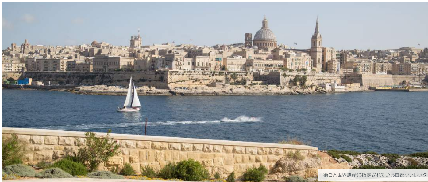
街ごと世界遺産に指定されている首都ヴァレッタ