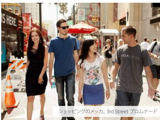
ショッピングのメッカ、3rd Street プロムナード