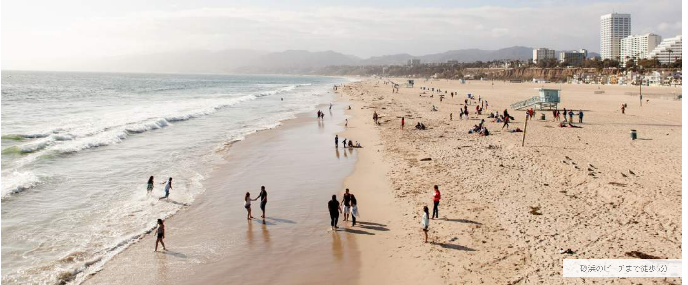
砂浜のビーチまで徒歩5分