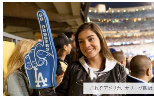
これぞアメリカ、大リーグ観戦