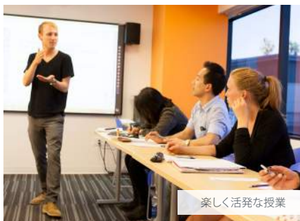
楽しく活発な授業