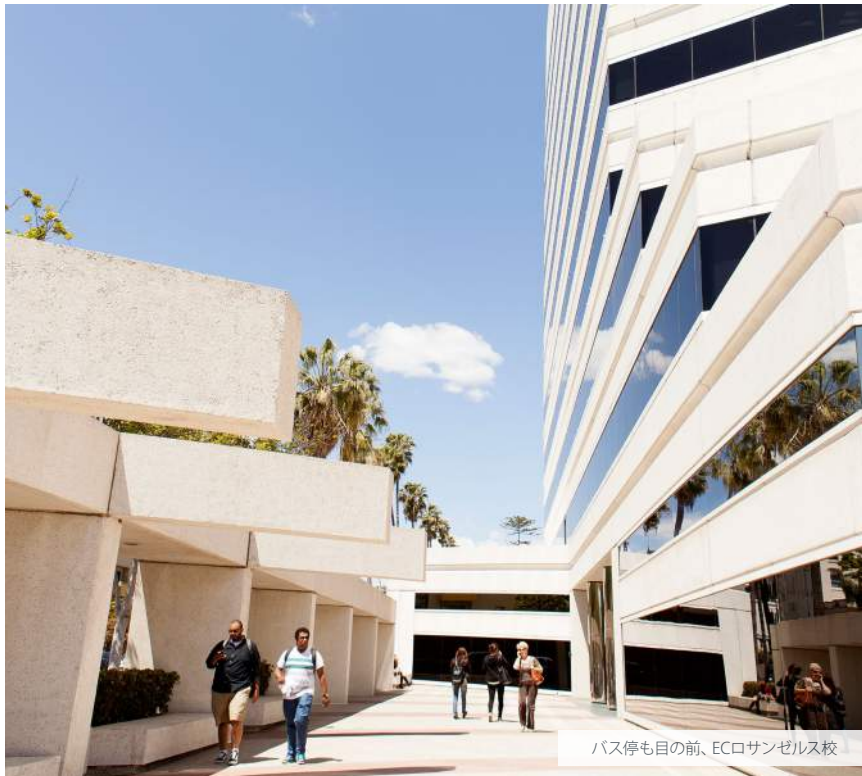
バス停も目の前、ECロサンゼルス校