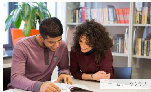
ホームワーククラブ