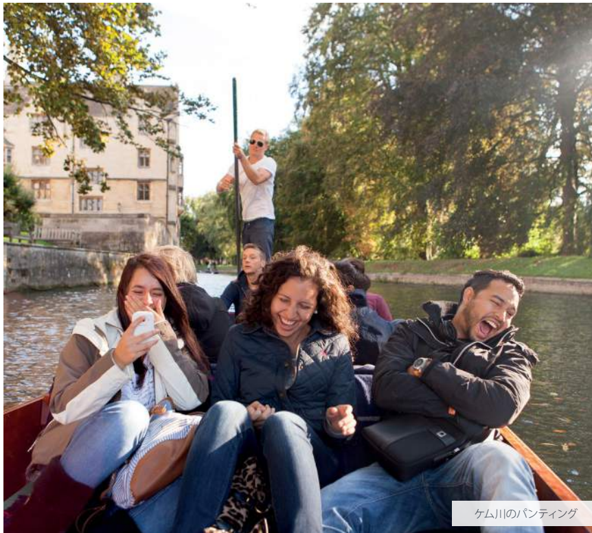
ケム川のパンティング