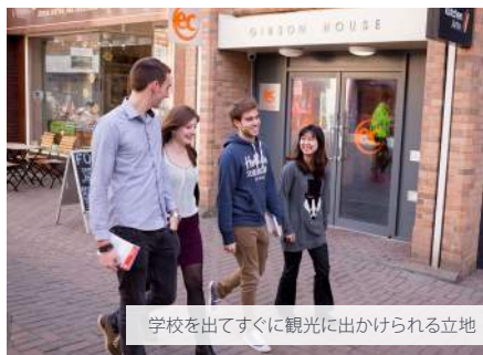
学校を出てすぐに観光に出かけられる立地