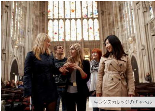
キングスカレッジのチャペル