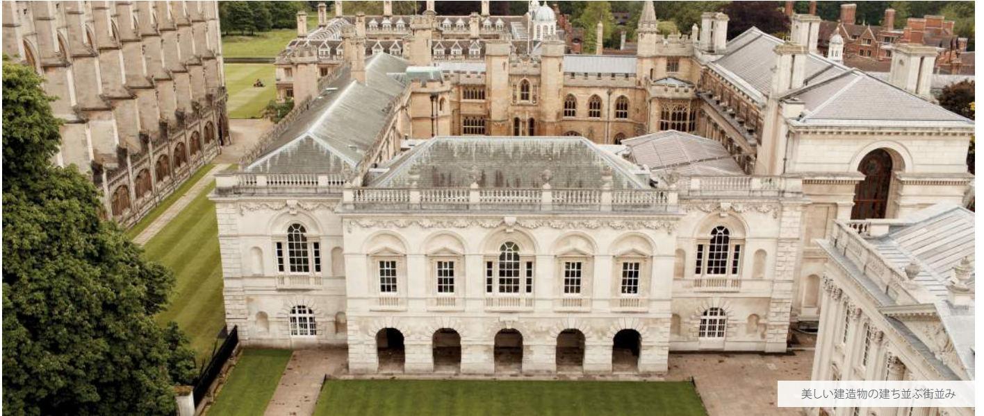
美しい建造物の建ち並ぶ街並み