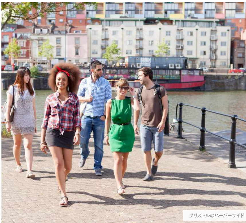
ブリストルのハーバーサイド