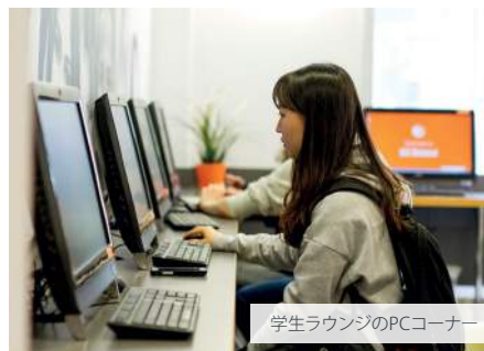
学生라운ジのPCコーナー