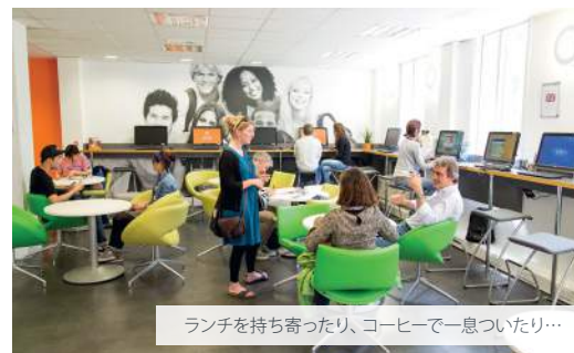
ランチを持ち寄ったり、コーヒーで一息ついたり...