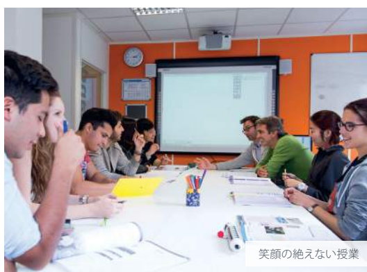
笑顔の絶えない授業