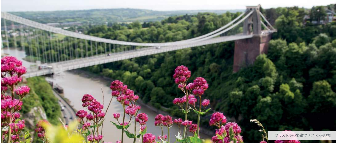
ブリストルの象徴クリフトン吊り橋