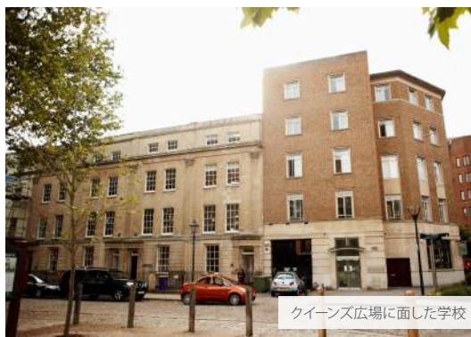
クイーンズ広場に面した学校