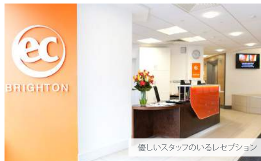
優しいスタッフのいるレセプション