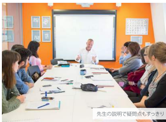
先生の説明で疑問点もすっきり