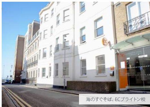
海のすぐそば、ECブライトン校