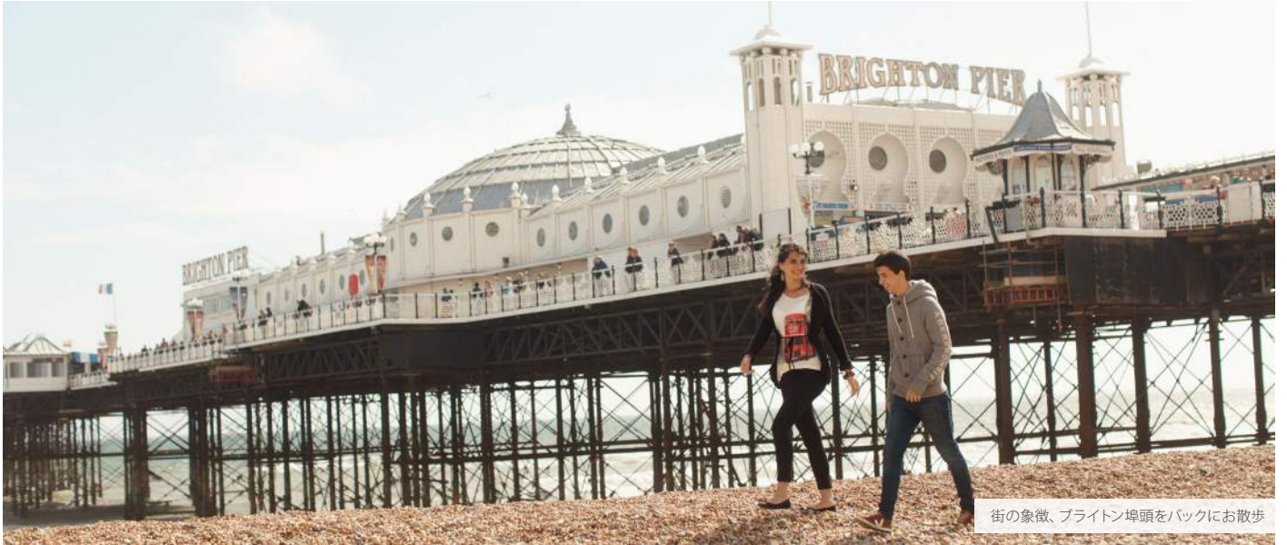
街の象徴、ブライトン埠頭をバックにお散歩