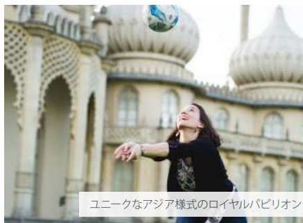
ユニークなアジア様式のロイヤルパビリオン