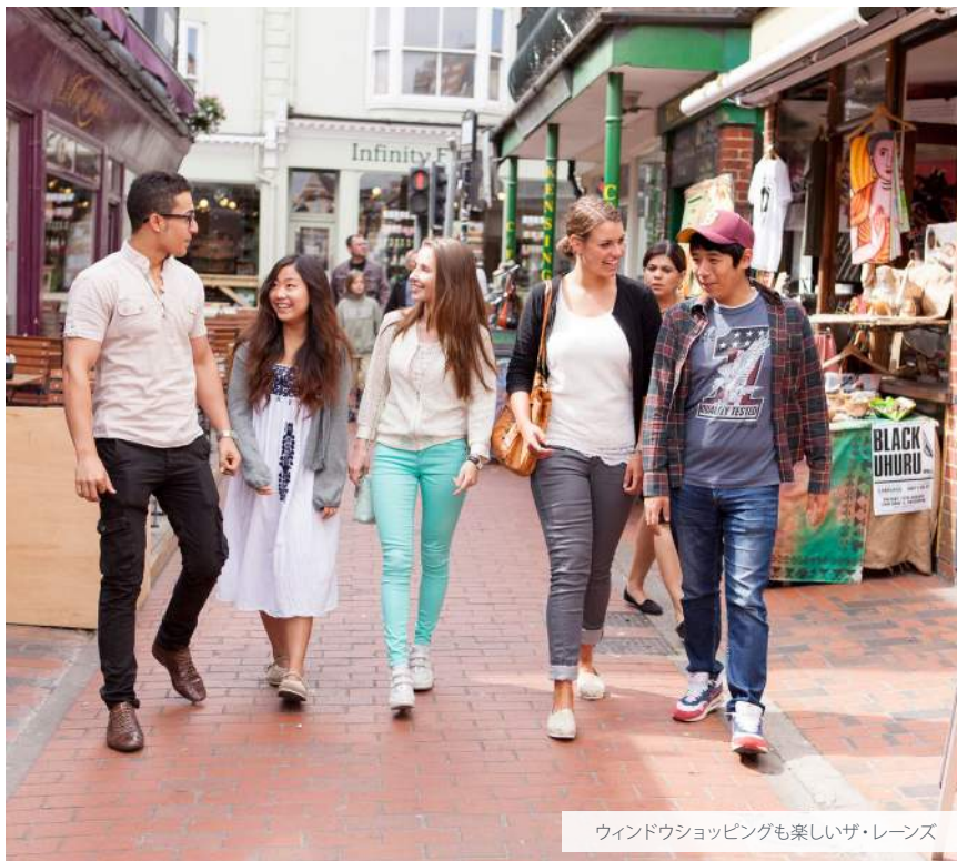
ウィンドウショッピングも楽しいザ・レーンズ