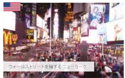
ウォールストリートを擁するニューヨーク

"ただのビジネス英語ではなく、将来の仕事に必要な知識を身につけたり、経験がしたくて、このコースを選びました。コースを通じて将来の目標が定まり、また自分の長所にも改めて気付けたので、帰国してからの仕事探しを楽しみになりました"