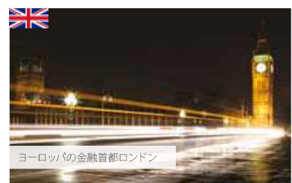
ヨーロッパの金融首都ロンドン