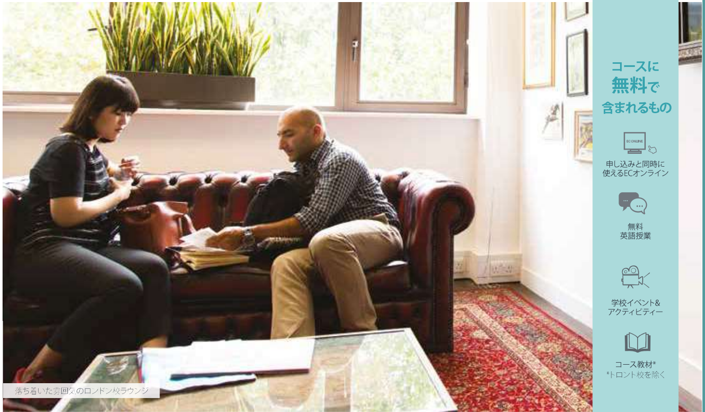
落ち着いた雰囲気のロンドン校ラウンジ